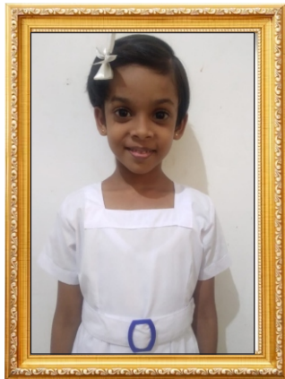
-කතාව- ජෙනුකි සෙසන්ලි පතිරණ

මෙයට සෙනෙවිරත්න මහලේකම් පාසල් දරුවන් ග්‍රන්ථකරණයට යොමුකළ ව්‍යාපෘතියේ නිර්මාපක 2023 . 11 . 01