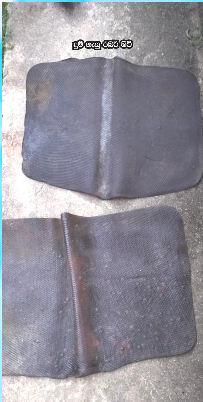
දුම් ගැසූ රබර් ෂීට්