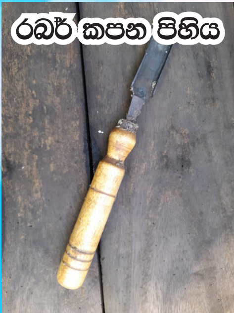
රබර් කපන පිහිය