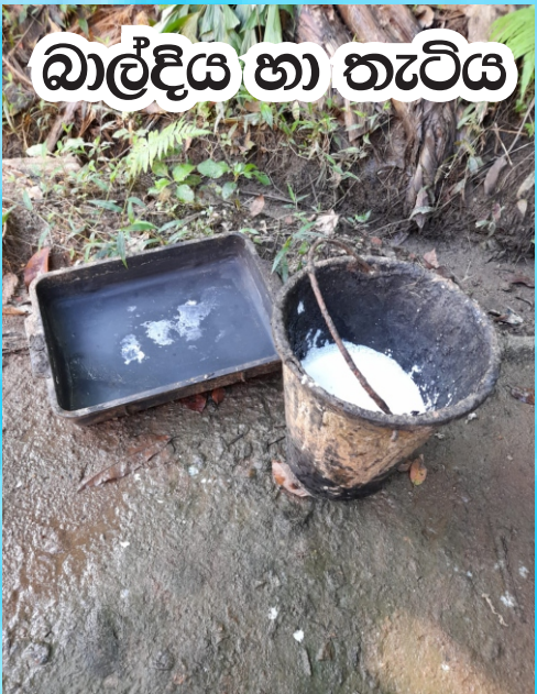
බාල්දිය හා තැටිය